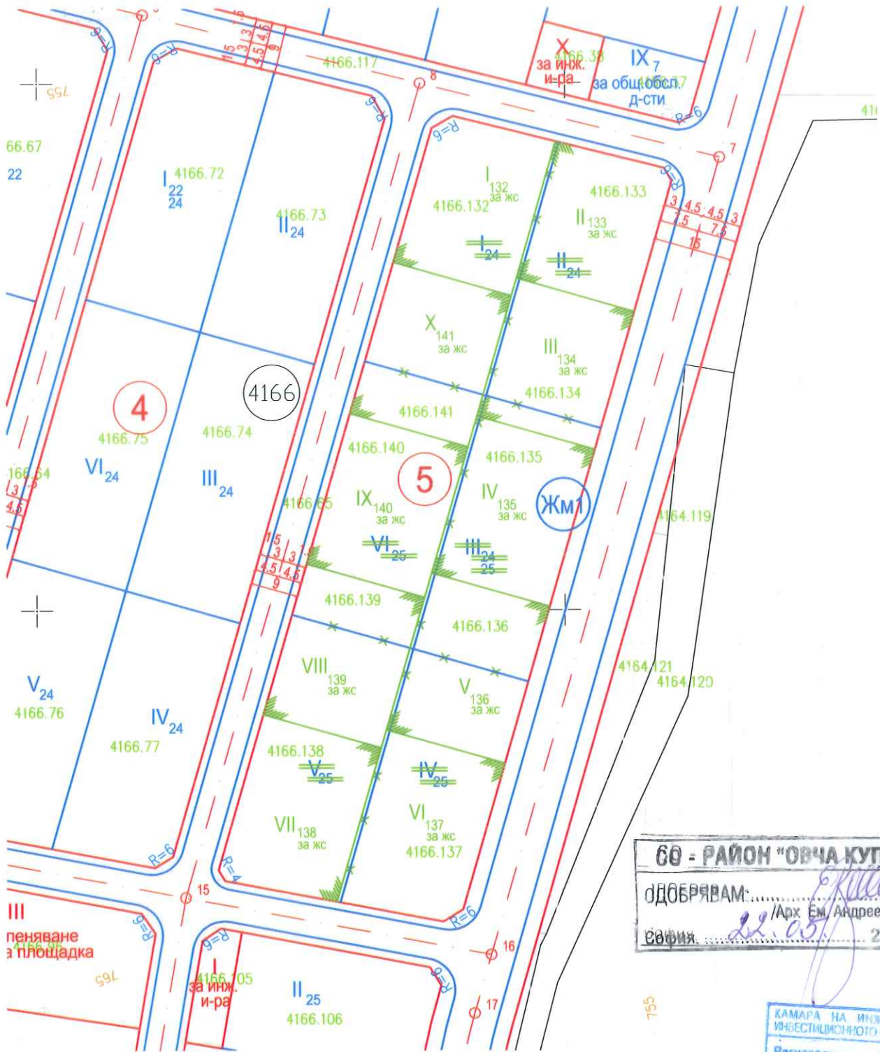
ПРОЕКТ ЗА ИЗМЕНЕНИЕ НА ПУП - ПР ЗА КВ. ГОРНА БАНЯ, М-СТ ДЪРНЬОВ КАМЪК М 1 : 1000

СО - РАЙОН "ОВЧА КУПЕЛ" ОДОБРЯВАМ: ..... София: 22.05.2015 г.